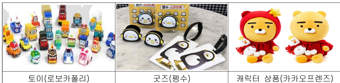
【IP융복합 상품 예시】

○ 결과물은 고양시 및 진흥원의 콘텐츠산업 홍보 등 공익 목적으로 활용 가능