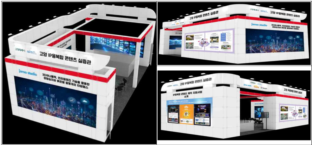
【2024년 실증관 디자인】

※ 과제별 LED, TV 등 장비 임차 비용은 기업 부담(2천만원 이내 예상)